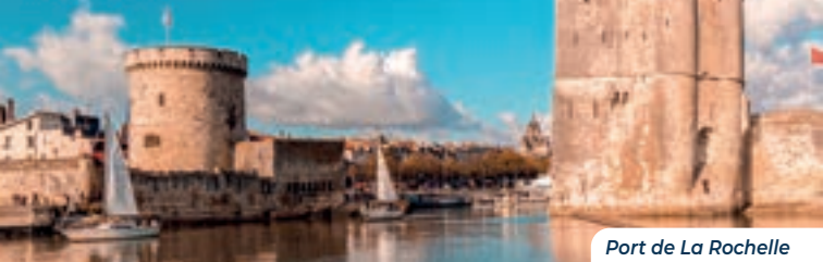
Port de La Rochelle