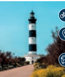
Phare de Chassiron