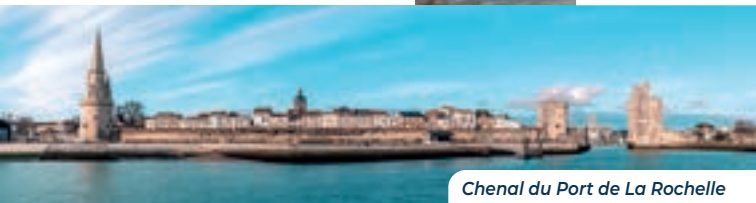
Chenal du Port de La Rochelle