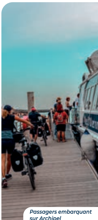
Passagers embarquant sur Archipel