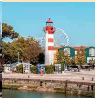
Tours de La Rochelle