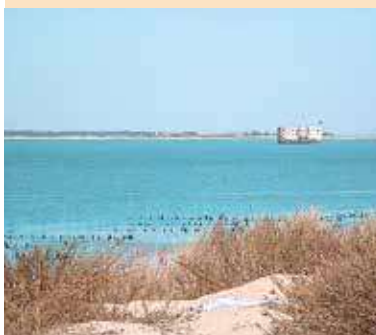
Plage des Saumonards

Ce petit village nature, à quelques kilomètres de Fort Boyard , est bordé au nord par la forêt des Saumonards et ses belles plages de sable fin . À seulement 10 mn à pied, découvrez l'ostréiculture traditionnelle à travers la visite du site ostréicole et naturel de Fort Royer : randonnées pédestres au milieu des claires, dunes, chenaux et cabanes multicolores en bois... Une pause hors du temps !