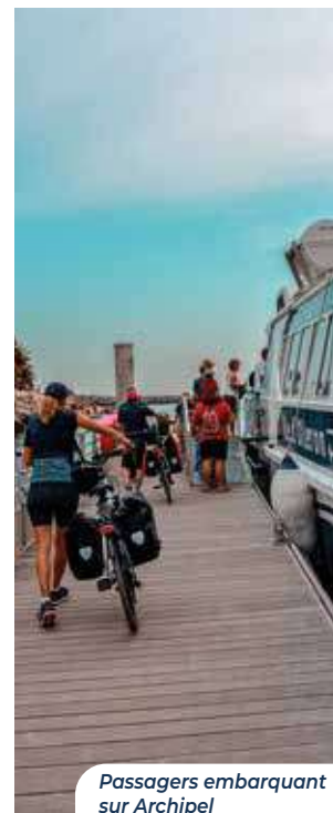
Passagers embarquant sur Archipel