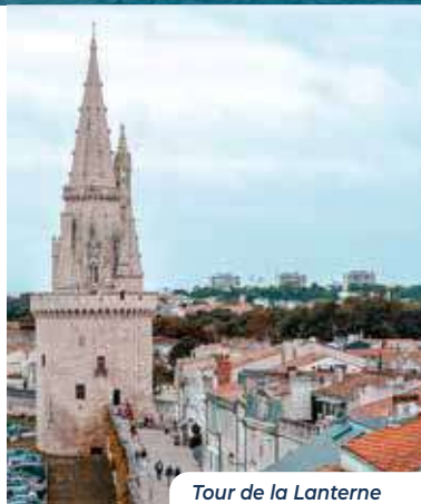
Tour de la Lanterne

/ Visitez l'un des nombreux musées de la ville (Musée Maritime, Histoire Naturelle, Beaux-Arts, Musée des Automates, Musée du Nouveau Monde).