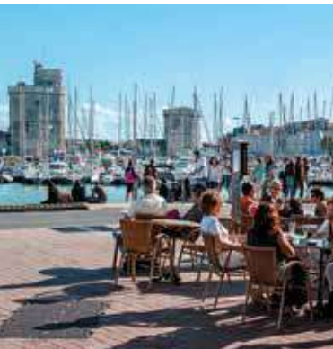
Vieux-Port de La Rochelle

Bénéficiez d'un tarif spécial pour la visite des 2 tours (8 € au lieu de 9,50 €). Gratuit pour les moins de 18 ans tours-la-rochelle.fr