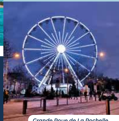
Grande Roue de La Rochelle

BÉNÉFICIEZ D'UN TARIF RÉDUIT SUR LES VISITES GUIDÉES larochelle-tourisme.com | 2 Quai Georges Simenon | 05 46 41 14 68